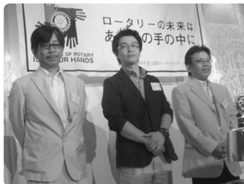
新 会 員 紹 介