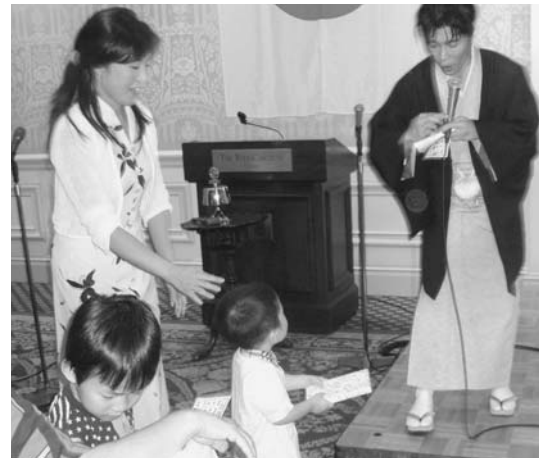
ビンゴゲームの様子