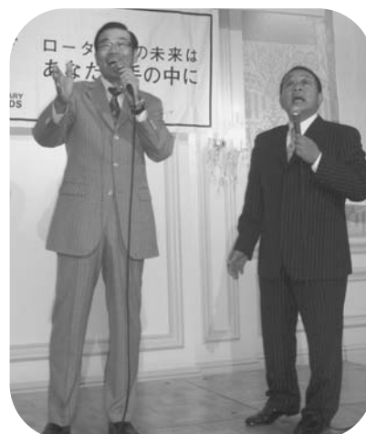
オール阪神・巨人の漫才