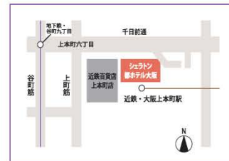
シェラトン都ホテル大阪

開会式 ..... 14:00 開会 分科会 ..... 15:20 開会 家族の集い ..... 15:20 開会 RI会長代理ご夫妻歓迎晩餐会 .. 18:00 開宴